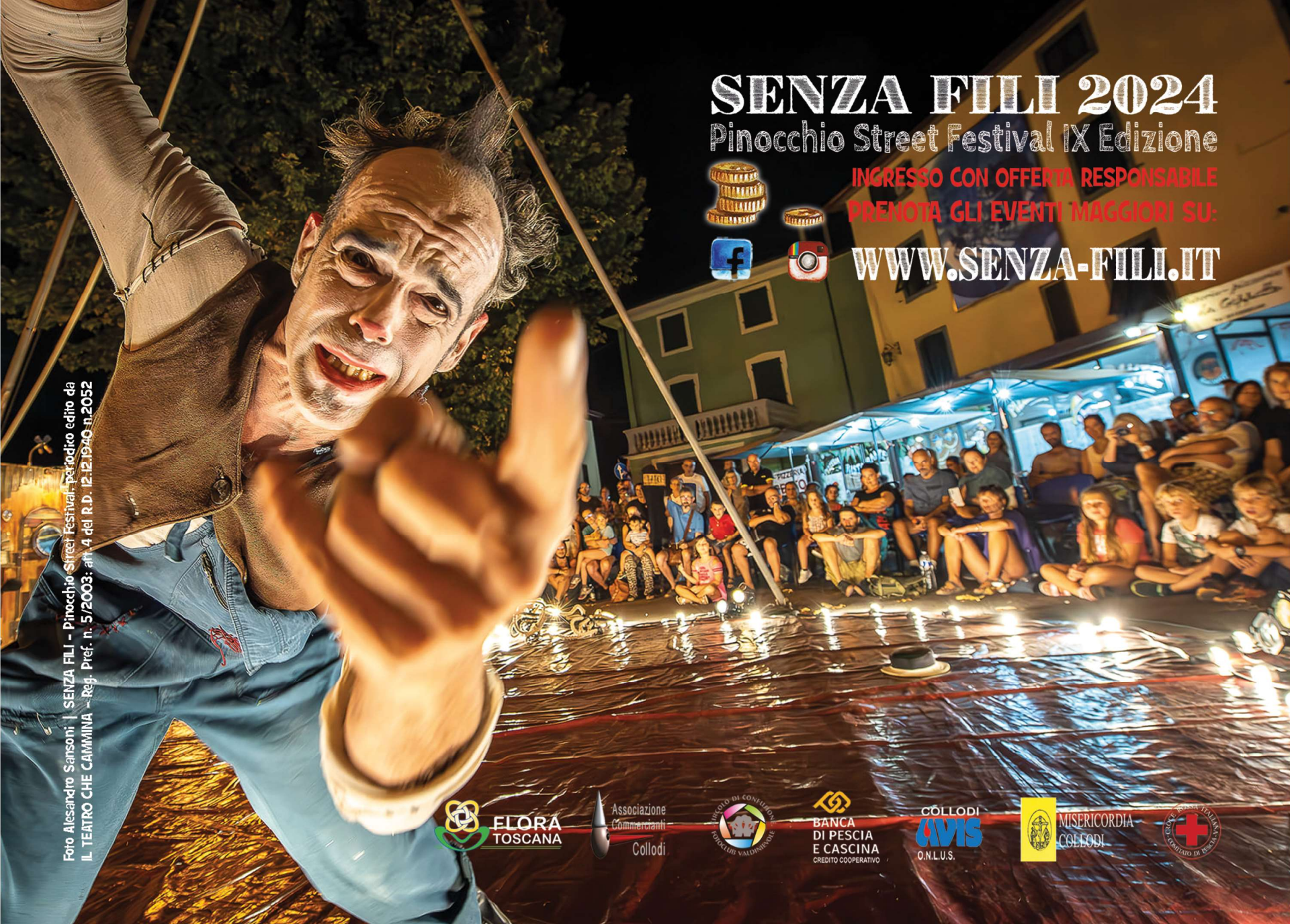
SENZA FILI - Pinocchio Street Festival - periodo edito da IL TEATRO CHE CAMMINA - Ref. Pref. n. 5/2003: art. 4 del R.D. 12.12.1940 n.2052